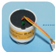
D-08/Art Nr: 223-0008