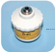
D-01/Art Nr: 223-0001