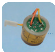
D-11/Art Nr: 223-0011