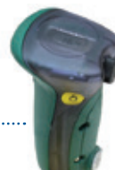
Analox O 2 EII