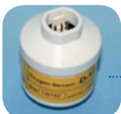
D-12/Art Nr: 223-0012