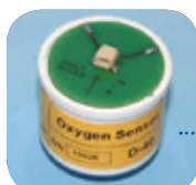
D-40/Art Nr: 223-0040