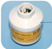
D-05R/Art Nr: 223-0015