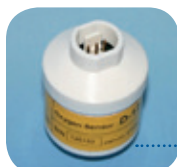
APD-14/Art Nr: 223-0112