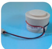
D-10/Art Nr: 223-0010