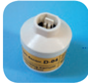
D-04/Art Nr: 223-0004