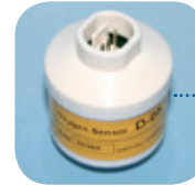
D-05/Art Nr: 223-0005