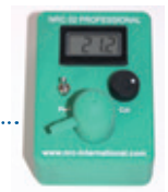
NRC Professional Analyzer until 2009