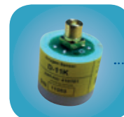
D-11k/Art Nr: 223-0111