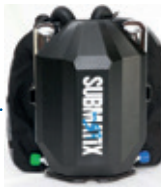
Submatix Quantum Mini