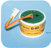
D-03/Art Nr: 223-0003