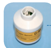
D-41/Art Nr: 223-0041