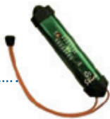
UBS O 2 Stick