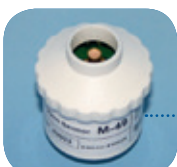
M-49/Art Nr: 223-0049