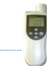
NRC Professional Analyzer until 2010