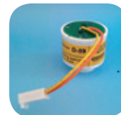
D-09/Art Nr: 223-0009