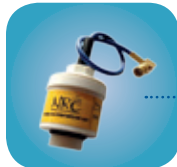
D-05JJ/Art Nr: 223-0025