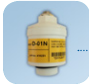
D-01N/Art Nr: 223-0101