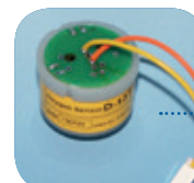
D-13/Art Nr: 223-0013