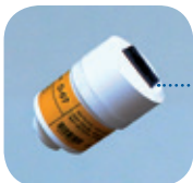
D-07/Art Nr: 223-0007