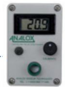
Analox O 2